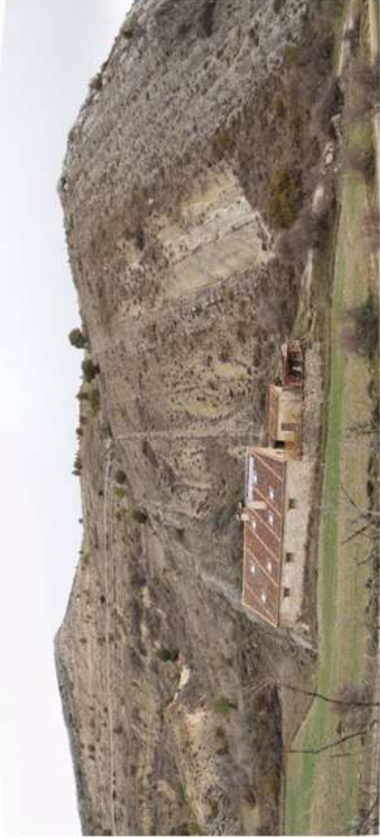
Figura 10. Panorámica del Cretácico de Grado de Pico (Segovia)