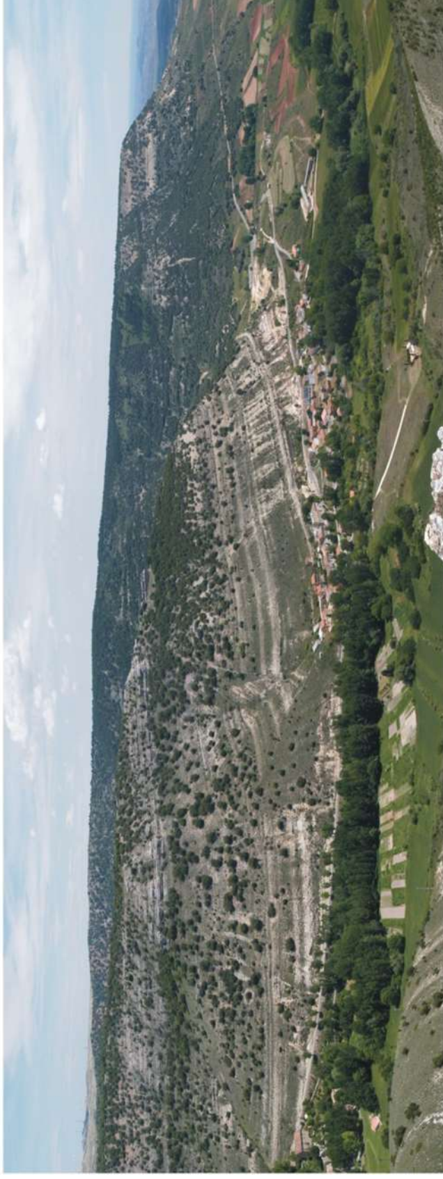
Figura 9. Panorámica de la sección estratigráfica del Cretácico en las laderas de Somolinos (Guadalajara)