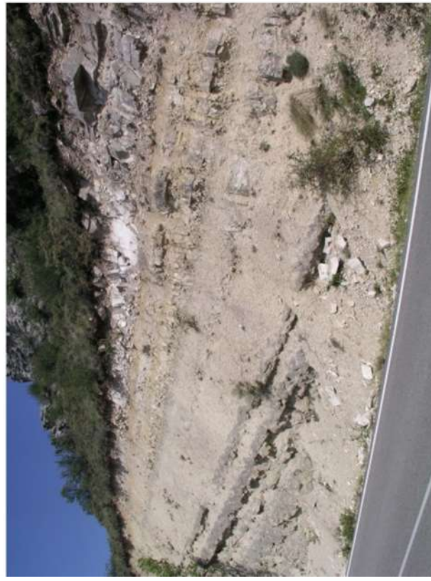
Figura 6. Capa de Margas de Alcorlo en su sección tipo