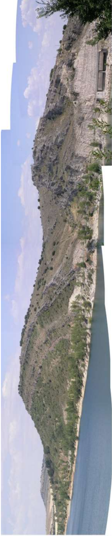
Figura 1. Panorámica de la sección estratigráfica del Cretácico en el Embalse de Alcorlo (Guadalajara).