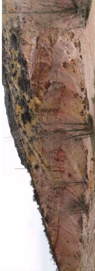
Figura 2. Fm Arenas de Utrillas en el Cruce de Veguillas