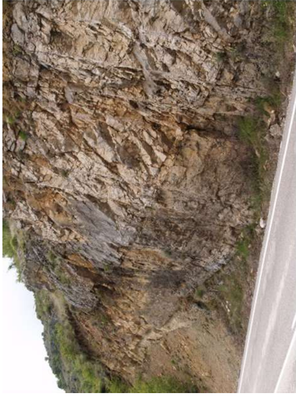
Figura 4. Mb Calcarenititas de Riofrio del Llano