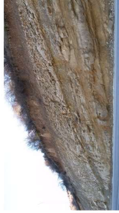
Figura 3 Dolomías de Villa de Vés y Margas de Picofrentes en la carretera de Veguillas al Embalse de Alcorlo