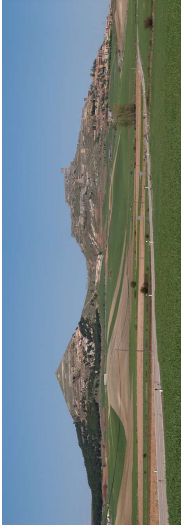
Figura 8. Panorámica de los cerros cretácicos de Atienza. A la izquierda el Cerro del Padrastro, sección tipo del Mb Arenas de Atienza