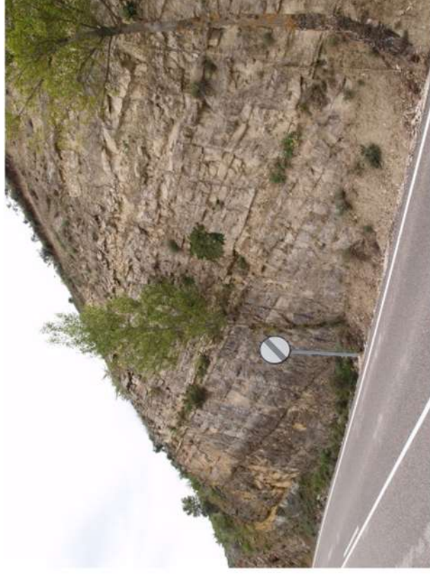
Figura 5. Mb. Dolomias de Muriel