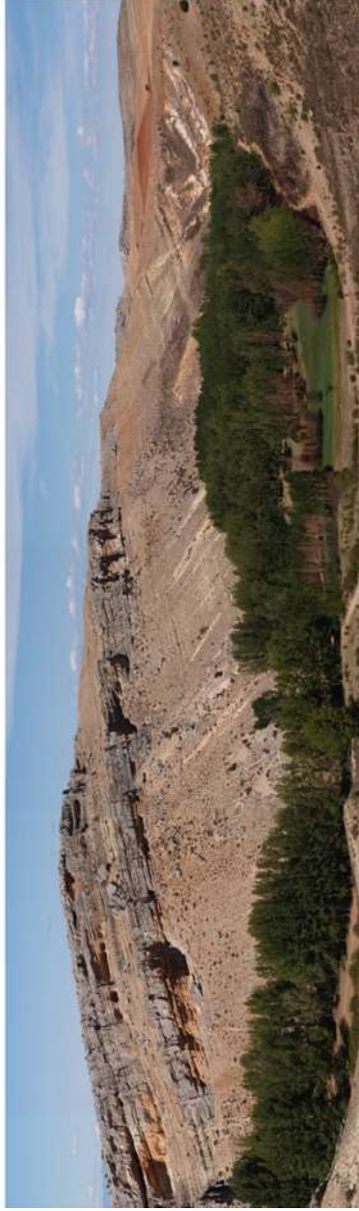
Figura 11. Panorámica de la sección estratigráfica del Cretácico en Ligos (Segovia)