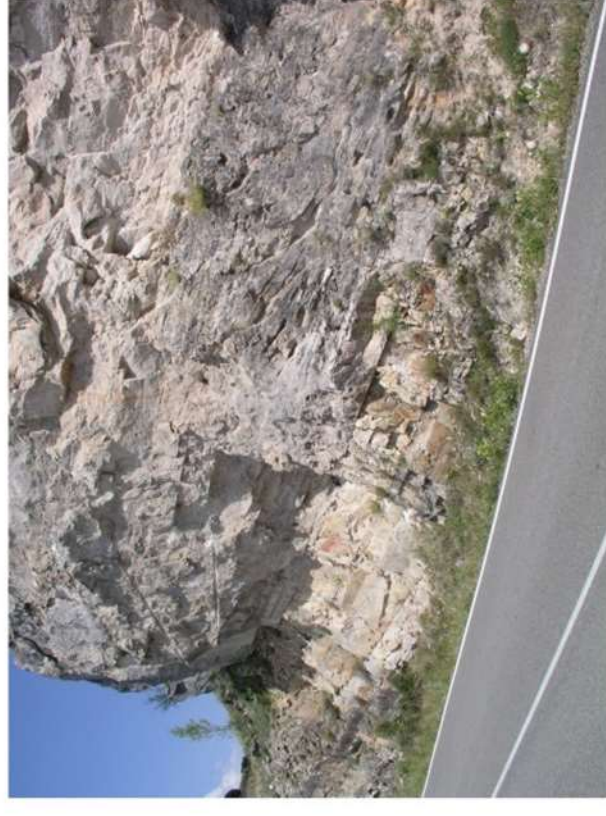
Figura 7. Formación Dolomias de Somolinos